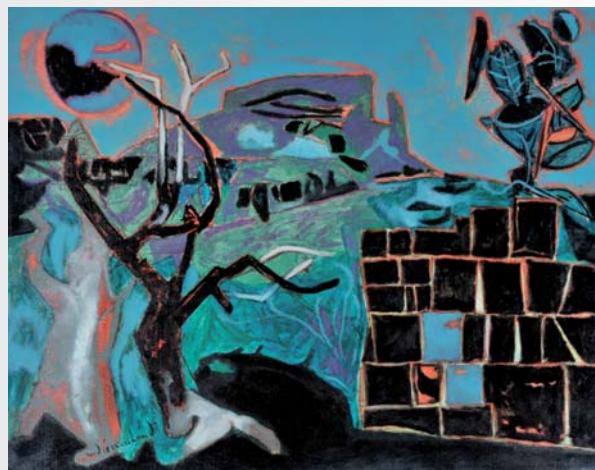
André Marchand - "La nuit à Fontvieille" - Collection Musée Estrine.

Le musée Estrine a mis en place, en partenariat avec la CCVBA, un projet pédagogique amenant une classe de chaque commune à travailler via des médias différents (design, photographie, dessin, peinture, etc...) sur le thème du paysage. Cinq plasticiens, eux-mêmes résidents du territoire, coordonnent ces ateliers. Les travaux des enfants seront présentés au Musée Estrine en parallèle de l'exposition.