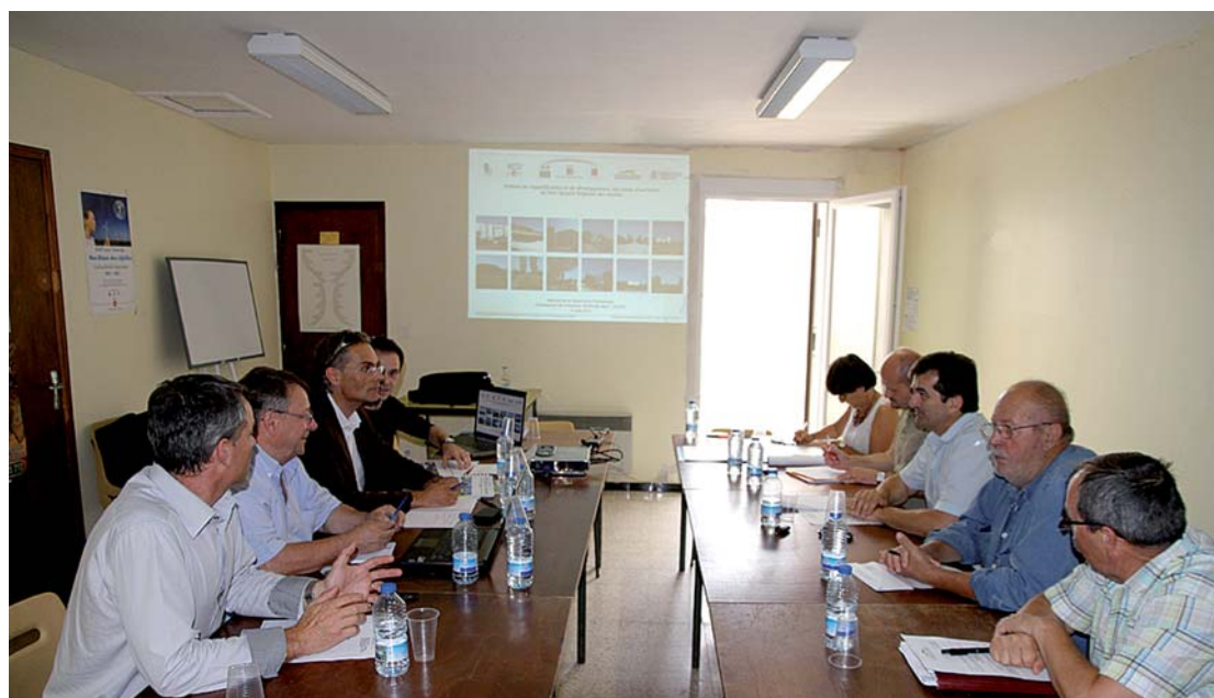
Une réunion de la Commission développement économique de la CCVBA.