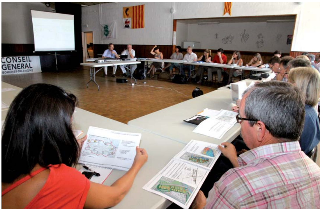
La salle des fêtes de Mas Blanc des Alpilles a accueilli la réunion de présentation du schéma de requalification et de développement des zones d'activités du Parc naturel régional des Alpilles.

Au-delà du simple rapport factuel, ce Schéma démontre la volonté d'établir une synergie entre différents acteurs qui contribuent au développement et à l'harmonisation de notre territoire. Le dialogue est bien ouvert entre le Parc, la CCVBA et la CCI du pays d'Arles. En effet, avec ce schéma destiné à accompagner l'évaluation et le déroulé de nouveaux projets ou d'extension de zones d'activité, élus, techniciens, chefs