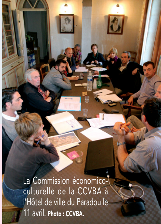
La Commission économique-culturelle de la CCVBA à l'Hôtel de ville du Paradou le 11 avril.