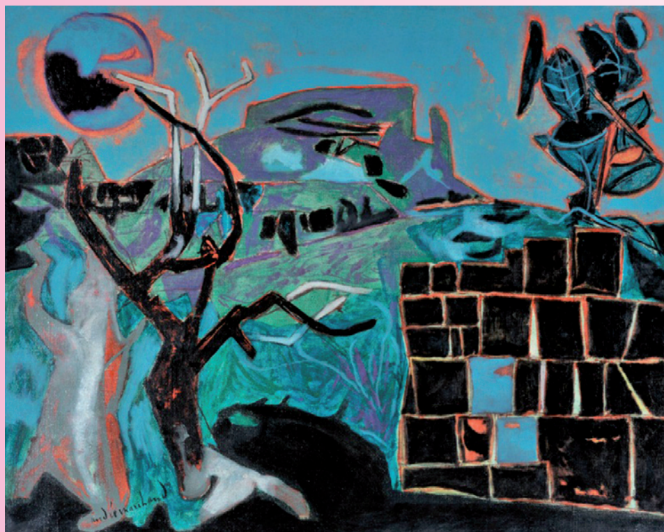
André Marchand, "La nuit à Fontvieille ©.1945 - Musée Estrine - Cliché Jean Bernard.

■ Le détail des autres projets et la suite du dossier CCVBA - MP2013 dans le prochain bulletin de la CCVBA.