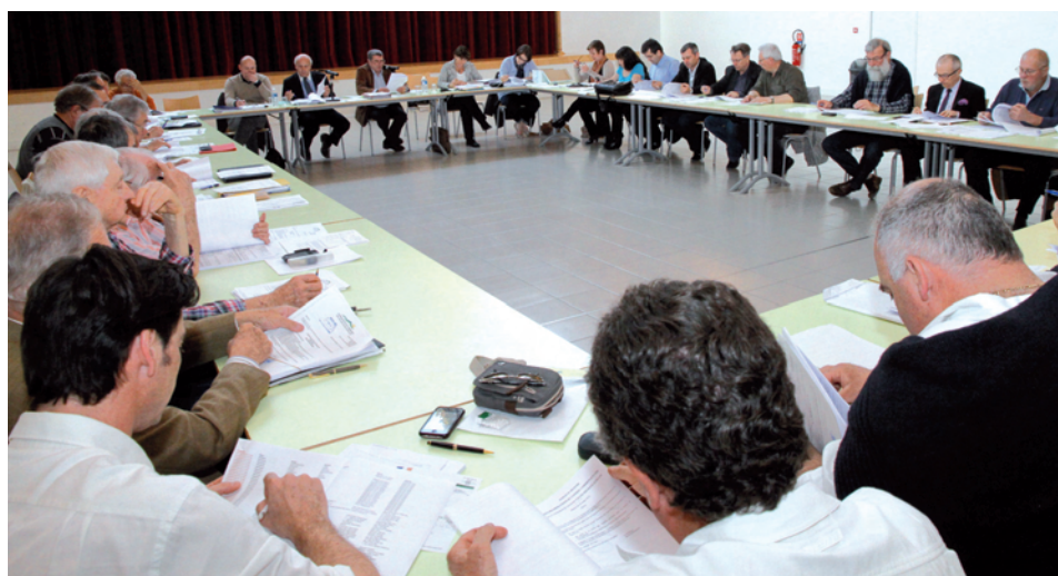
Le 26 mars, le Conseil de communauté a voté le budget primitif de la CCVBA à l'espace Agora à Maussane les Alpilles.